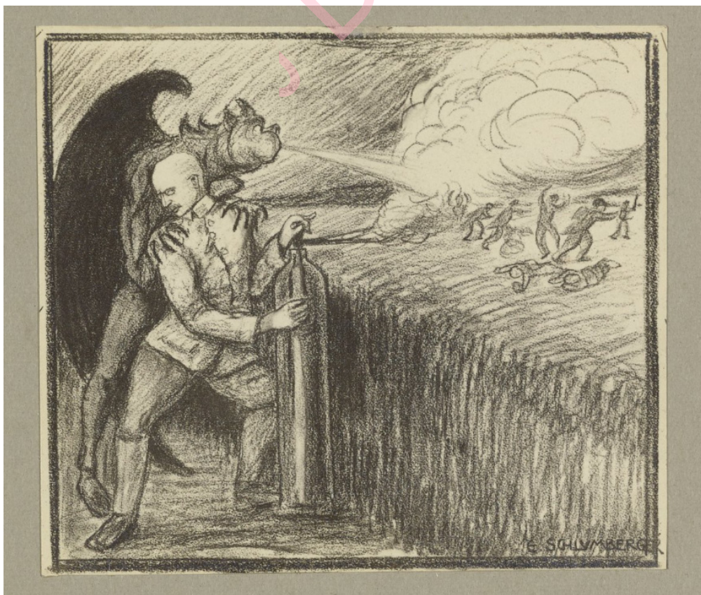
图3 哈伯在一战战场上释放毒气的讽刺画，作于1910-1940年之间。原作现存于费城科学史研究所的耶奥格·布雷迪格和马克斯·布雷迪格档案（the Papers of Georg and Max Bredig）

第二，化学家是否可以从事化学武器及相关的研究。这是一个非常复杂的伦理问题。化学家的职业伦理很难简单应对这个问题，化学家还具有其他的社会身份，对不同群体的义务可能使他陷入伦理困境。化学家作为公民有义务为国防做贡献，参与武器研发，作为雇员他可能被迫从事相关的研究；而作为人类社会的一员，化学家或许会认为使用化学武器是不道