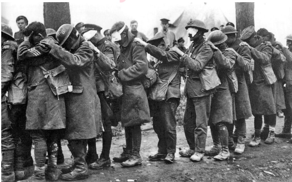
图2 1918年4月10日,在埃斯泰尔战役中因芥子气导致失明的英军第55师士兵

毒气战极其残酷,死亡来得缓慢而痛苦,战场上已没有荣誉可言,现代战争变得肮脏和无法想象的恐怖(图2)。毒气不仅给士兵带来无法治愈的身体伤害,还会伴有长期的战后应激反应,如毒气神经官能症和毒气瘕症等。然而,哈伯坚持毒气战是更“人道的”战争,“毒